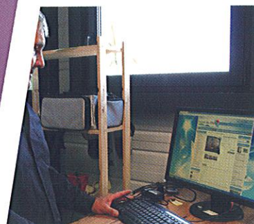
La Bourse des affaires

Le dynamisme de nos zones d'activités se traduit par de nouvelles actualités.